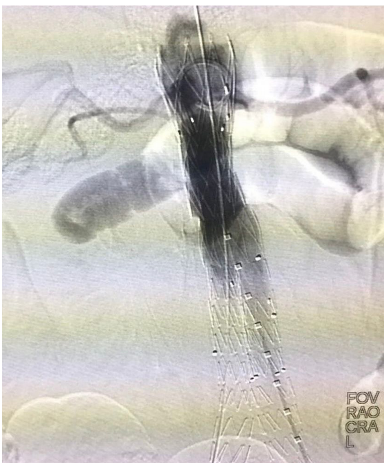
2- Aneurisma depois do implante da Endoprótese.