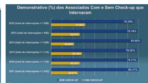
A Prestação de Contas foi acompanhada por graficos explicativos