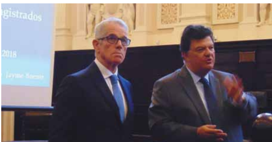
O Ministro do STJ e ex-presidente da Mútua Antonio Saldanha Palheiro, com o Des. Antônio Jayme Boente, atual presidente, durante a prestação de contas

pecto cada vez mais empresarial sem perder a afeição e carinho com que seus associados são tratados. (Páginas 4/5 e 8)