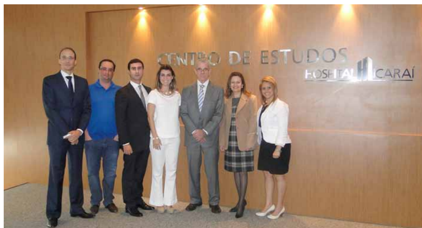
Membros da diretoria da Mútua, durante visita ao Hospital Icaraí