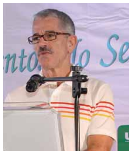
O Desembargador Antonio Saldanha Palheiro

Estiveram presentes 54 Juízes de Varas Cíveis, Juizados Especiais Cíveis, Turmas Recursais Cíveis, Empresariais e de Fazenda Pública; 30 Desembargadores Cíveis, 14 magistrados das 1ª e 2ª instâncias (Criminal, Família, Infância e Órfãos e Sucessões) e dois magistrados aposentados. ( Páginas 6, 7, 8 e 9 )